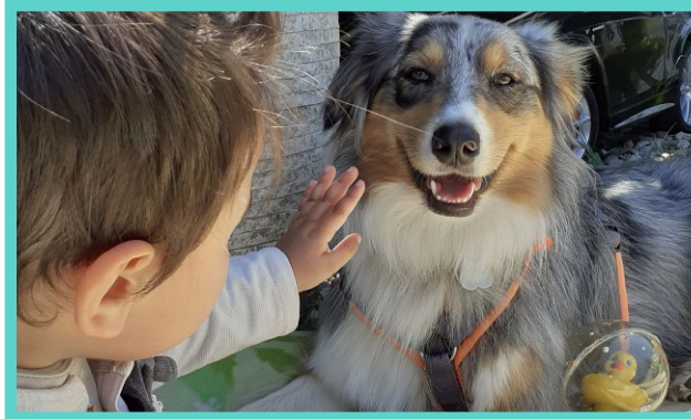
Zusätzlich werden wir unterstützt von der Therapie-Hündin „Emmi“

Mit Empathie, Geduld und Fachwissen begleiten wir Sie wertschätzend auf Ihrem Weg.